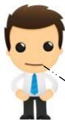
Assistant de gestion

Notre entreprise doit 3 385,64 € au fournisseur LAUZIERES c'est le net à payer de la facture (c'est la RESSOURCE ).