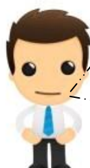
Assistant de gestion

Nous avons réglé par chèque la facture FF00000004 d'un montant de 3 385,64 € au fournisseur LAUZIERES (c'est l' EMPLOI )