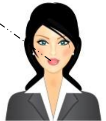
Evelyne MASSON Responsable administrative

Pour vérifier si vous avez assimilé les éléments précédents, vous allez procéder à l'analyse des flux générés avec notre fournisseur MEUBLES MODULABLES LAUZIERES à qui nous avons acheté des marchandises (modules de bureau) à crédit (paiement différé).