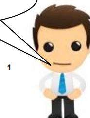
Assistant de gestion

Je fais le lien entre la facture et l'écriture comptable.